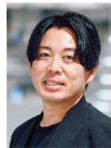
株式会社ナレッジワーク CEO (Chief Executive Officer) CPO (Chief Product Officer)

生成AIやAIエージェントの進化により、企業組織の在り方は大きな転換点を迎えています。一方で、企業における生成AIプロジェクトの多くは、期待されたROI創出に至っていないのが実情です。ナレッジワークは、営業担当が成長し、継続的に成果を生み出せる変革の実現に向け、主に大手企業を対象にセールスAXソリューションを提供しています。数千名規模の営業組織への導入・変革支援に携わってきた経験をもとに、本講演ではAXを阻む4つの壁と、その乗り越え方をご紹介します。