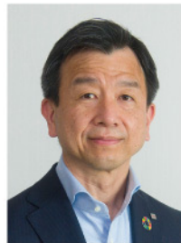
リコージャパン株式会社 取締役 会長執行役員

DXが進む一方、「現場の具体的な変化や成果に繋がらない」と感じていませんか？AIが当たり前となった今、社員一人ひとりが創造性を発揮し、自律的に価値を生み出しながら“はたらく”ために、リーダーが考えるべき視点を深掘りします。リコーは、世界140万社のお客様との対話と社内実践で培った「現場知」をもとに、共創を通じた価値創出に取り組んできました。組織のカルチャー変革を通じて、自律的な社員の躍動が企業の持続可能な成長に繋がる。本講演では、その実現に向けたリコーならではの示唆をお届けします。