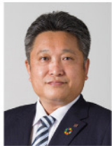
株式会社リコー 経営企画本部 デジタルビジネスイノベーション事業部 事業部長

各社DXでの事業成長を目指す中、AIの進化は留まることを知らない。その活用はもはや経営のアジェンダ、いち早く企業活動へ浸透させた企業とそうでない企業の成長スピードは益々開くことに。各社AI導入を進める一方で企業活動への適用には試行錯誤している段階でもあり、そのノウハウこそがお客様へ貢献できる原動力となる。まずは徹底的な社内実践でノウハウを獲得し、お客様の経営課題に伴走させていただきながら解決を共に図る、そんな貢献スタイルへのチャレンジを紹介させていただきます。