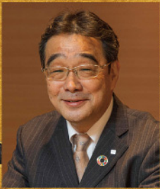
リコージャパン株式会社 代表取締役 社長執行役員 CEO