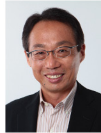
株式会社今治・夢スポーツ 代表取締役会長

サッカー日本代表監督やJリーグの監督経験から得て、さらに現在も企業経営で実行している“組織を一つにする方法”について、具体的なエピソードを織り交ぜながらお話しします。