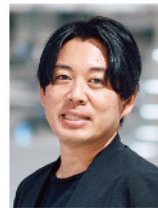
株式会社ナレッジワーク CEO (Chief Executive Officer) CPO (Chief Product Officer)

生成AIやAIエージェントの進化により、企業組織の在り方は大きな転換点を迎えています。一方で、企業における生成AIプロジェクトの多くは、期待されたROI創出に至っていないのが実情です。ナレッジワークは、営業担当が成長し、継続的に成果を生み出せる変革の実現に向け、主に大手企業を対象にセールスAXソリューションを提供しています。数千名規模の営業組織への導入・変革支援に携わってきた経験をもとに、本講演ではAXを阻む4つの壁と、その乗り越え方をご紹介します。