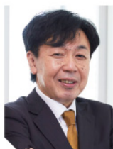
株式会社 タナベコンサルティンググループ 専務取締役

～フロンティア～未開の地を発見し、恐れることなく乗り込んでいくことを意味します。社会や顧客の価値観が同期化して劇的な転換をしている今、至る所で新しい需要が湧き出ています。従来のマーケットや既存の顧客だけをターゲットとしているだけでは、成長へのチャンスを逃すだけでなく、ライバルからも出遅れてしまう競争環境といえます。成長へのキーワードは「非顧客の顧客化」。今まで自社が目をつけていなかった未開のマーケットに向けて、積極果敢に挑戦していきましょう!! …こんな思いを、この戦略コンセプトに込めています。