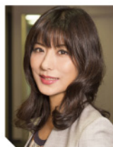
株式会社ワーク・ライフバランス 代表取締役社長

3,000社の支援実績から、労働時間を削減しつつ業績・採用力を高めた事例と、明日から実践できる働き方改革・マネジメント手法をご紹介します。