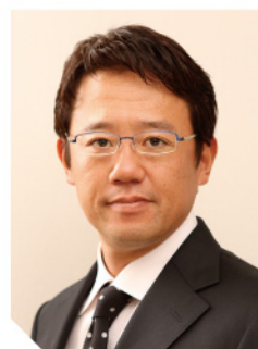
元プロ野球選手 スポーツコメンテーター

野村監督の下でプレーした経験やプレイングマネージャーとしての経験を基に、チームマネジメントやリーダーシップ・上司と部下の在り方・モチベーションの保ち方など、またチームづくりや心と身体のケアなどについてお話しいたします。選手として、監督として、日本プロ野球界で活躍してきた数々の経験から、ビジネスにも応用できる、チームの組織力やマネジメントに関して幅広くお伝えいたします。