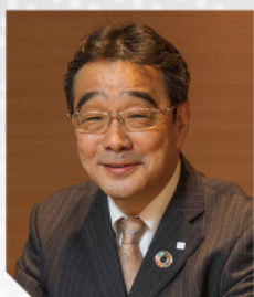
リコージャパン株式会社 代表取締役 社長執行役員 CEO