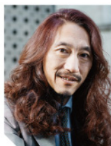
株式会社圓窓 代表取締役

DXという言葉がスウェーデンで生まれてから早20年。今でも日本ではビジネスシーンのホットワードであり続けています。生成AIの発展のスピードがさらにアップしている昨今、DXについて改めて考える機会にしましょう。