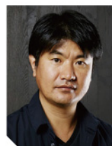
日清食品ホールディングス株式会社 情報システムプラットフォーム 執行役員CIO グループ情報責任者

日清食品グループでは、2030年に向けた中長期成長戦略の実現に寄与するため、グループ全体でデジタル化施策を強化しています。新たなデジタル部隊を組成し、生成AIを活用して業務生産性の向上を目指し、さらにAIエージェントによる業務プロセスの革新を進めるためのユースケースづくりに注力しています。これらの全社的な「デジタル武装」戦略と、現在進行形で進捗している具体的な取り組みについてご紹介いたします。