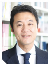
早稲田大学大学院経営管理研究科/ 早稲田大学ビジネススクール 教授

近年、様々な業界で生成系AIの活用とDX推進が重要視され、日本企業の経営にとっては避けては通れない経営課題となっております。しかしながら「なぜ必要なのか」「どう経営に活かせばいいのか」という、真の理解が十分には浸透していません。本講演では、世界の経営学の知見を使いながら、生成系AI・DXの方向への示唆、データ経営について考えていきます。