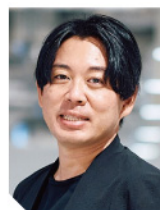
株式会社ナレッジワーク 代表取締役CEO

営業担当者の能力と成果を最大化する「セールスイネーブルメント」。本講演では、「みんなが売れる営業」になるための営業支援メソッドとして注目される全体像と、その実現に必要な「ナレッジ」「ワーク」「ラーニング」「ピープル」の4要素について解説いたします。さらに、様々な業種の大手企業様で導入されている営業支援ツール「ナレッジワーク」の具体的な活用方法と、導入企業での成果事例、そして営業活動をさらに進化させるAI活用についてもご紹介いたします。