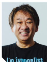
日本マイクロソフト株式会社 業務執行役員・エバンジェリスト

まだまだ進化を続けるAI技術。2022年末以降、Chat GPT/Copilotをはじめとする生成AIの登場により、私たちの仕事の進め方は大きな転換期を迎えています。企業における人材不足解消や業務効率化、新規事業開発など、さまざまな成長の原動力となる可能性を秘めています。そして考えるだけではなく行動までも実現するAIエージェントへと進化します。AIエージェントが既存のビジネスプロセスを変革する例を紹介し、企業の経営にもどのようなインパクトを与えるのかを解説いたします。