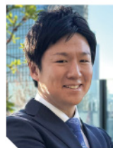
アスエネ株式会社 Founder & 代表取締役CEO

世界的な脱炭素化が加速する今、企業にとってGX(グリーン・トランスフォーメーション)経営の実践は、持続的成長のための必須要件です。本講演では、脱炭素経営の最新動向と各国の政策的背景を踏まえ、GXがいかに企業の競争力を高め、企業価値向上に繋がるかを解説。国際潮流を掴むための具体的な戦略・方針をお伝えいたします。